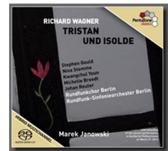
Tristan und Isolde