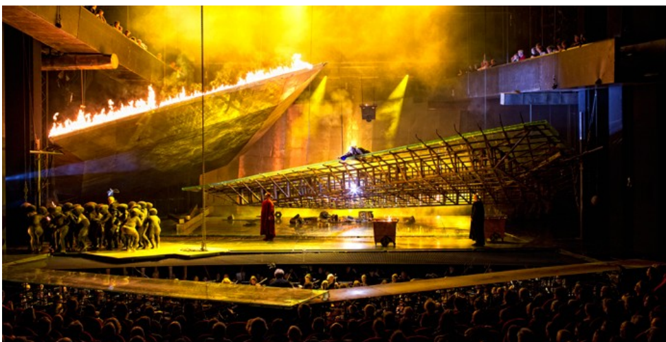
Het indrukwekkende "Nibelheim"