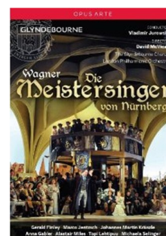
Die Meistersinger von Nürnberg

Het London Philharmonic Orchestra staat onder de leiding van Vladimir Jurowski .